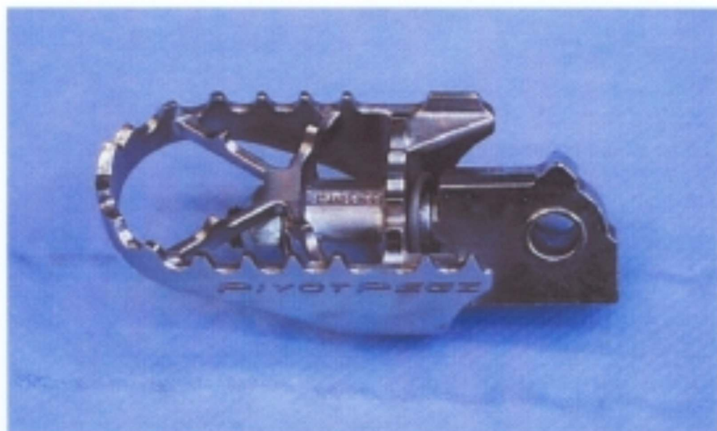
Bild: Prüfmuster Fußraste